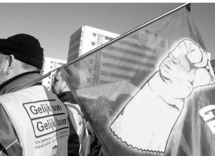
Schoonmakers maken een vuist bij Schiphol.

Organizing is een inspirerende strijdmethode die veel gebruikt wordt in de VS. In Nederland is de FNV een jaar of vijf geleden begonnen met union organizing, en Doorbraak-activisten snuffelen momenteel wat aan het verwante concept van het community organizing. Een kort overzicht van de mogelijkheden en problemen van een voor Nederland nieuwe methode.