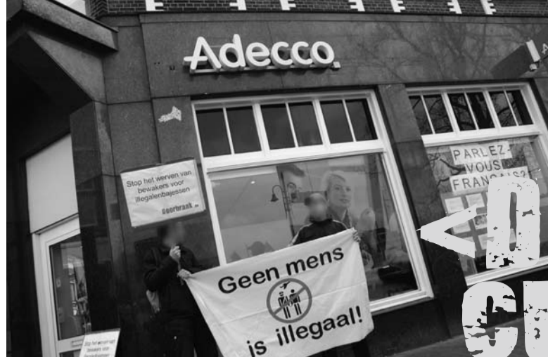
Doorbraak-actie tegen uitzendbureaus op 16 april 2010, mede geïnspireerd door AAGU.