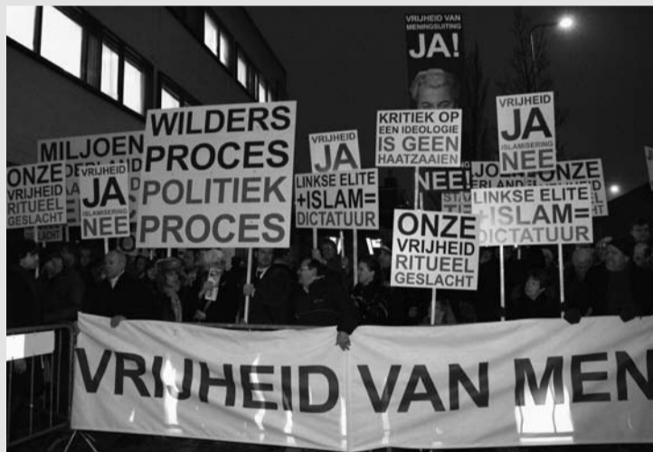
Fans bij Wilders-proces op 20 januari 2010. Internationaal wordt geld ingezameld voor de verdediging van de PVV-er.