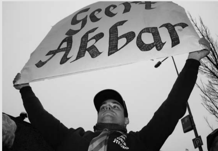
Fans bij Wilders-proces op 20 januari 2010. Internationaal wordt geld ingezameld voor de verdediging van de PVV-er.

PVV-leider Geert Wilders staat niet alleen in zijn onbehouwen strijd tegen links en de zelfverzonnen "islamisering" van het Westen. Vooral ultra-conservatieve en extreem-rechtse kopstukken uit landen als de VS, Denemarken, Italië, Groot-Brittannië en Israël steunen hem. Wie zijn die bondgenoten van Wilders en wat drijft hen?