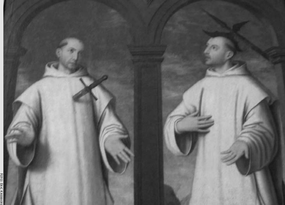
Schilderij in Spaans klooster met katholieke monniken die graag en veel lijden.