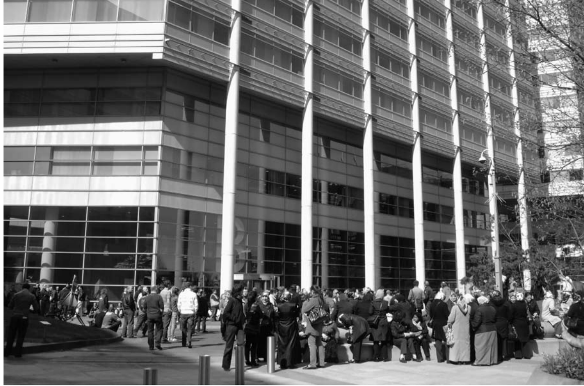
Sympathisanten van stakende schoonmakers protesteren bij opdrachtgever UWV.