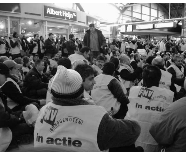
Schoonmakers bezetten de hal van Utrecht Centraal.

Aan de basis van de methoden van community organizing ligt het werk van de Amerikaanse organizer Saul Alinsky (1909-1972). 1 Veertig jaar lang vocht hij samen met allerlei communities in de VS tegen maatschappelijk onrecht. Alinsky begon zijn lange carrière als organizer in de jaren 30 bij de toenmalige Amerikaanse vakbondsfederatie CIO. Daarna was hij actief in arme wijken in onder meer Chicago, Kansas City, Detroit, Zuid-Californië en Oakland. Later ging hij zich speciaal richten op het verbeteren van de situaties in de zwarte getto's overal in de VS. Uit zijn strijdervaringen en die van vele anderen destilleerde hij algemene regels voor organizers. Die heeft hij vlak voor zijn dood vastgelegd in zijn boek "Rules for Radicals". 2