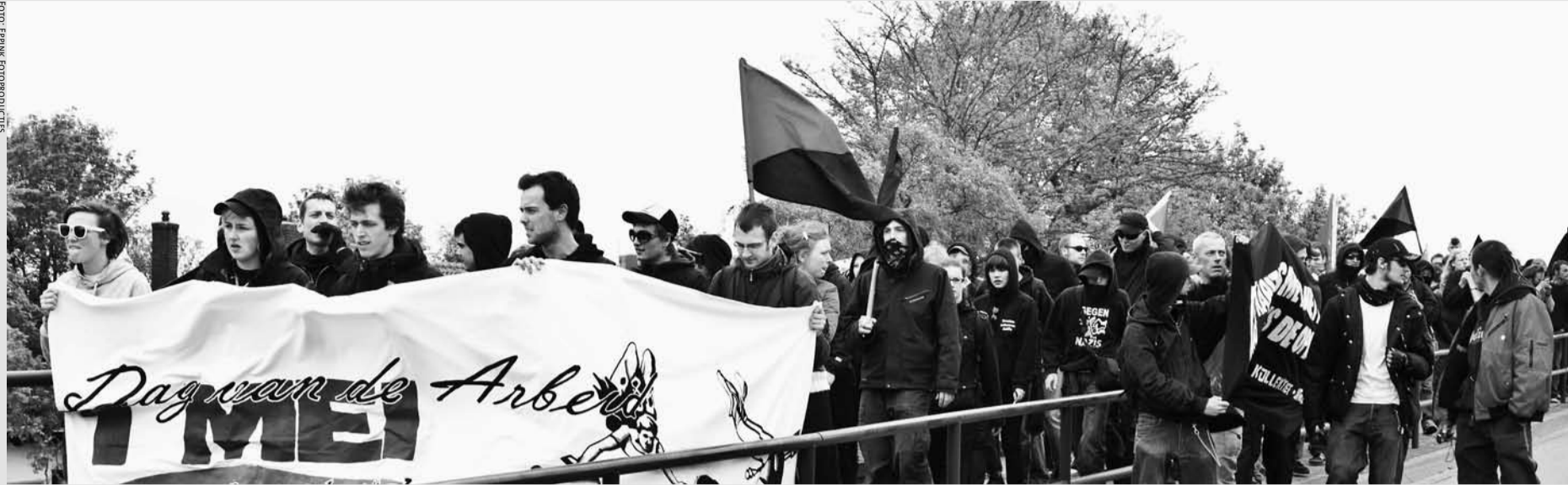
1 mei-demonstratie in Nijmegen.

Na de 1 mei-demonstratie in Nijmegen, die Doorbraak mede georganiseerd had, vond er 's avonds een discussiebijeenkomst plaats onder de demonstranten en de organiserende clubs, waar de vraag "hoe solidariteit te organiseren" centraal stond, want daar gaat het op 1 mei natuurlijk grotendeels om. Het debat maakte pijnlijk duidelijk dat daar nog maar weinig ideeën over zijn binnen radicaal-links.