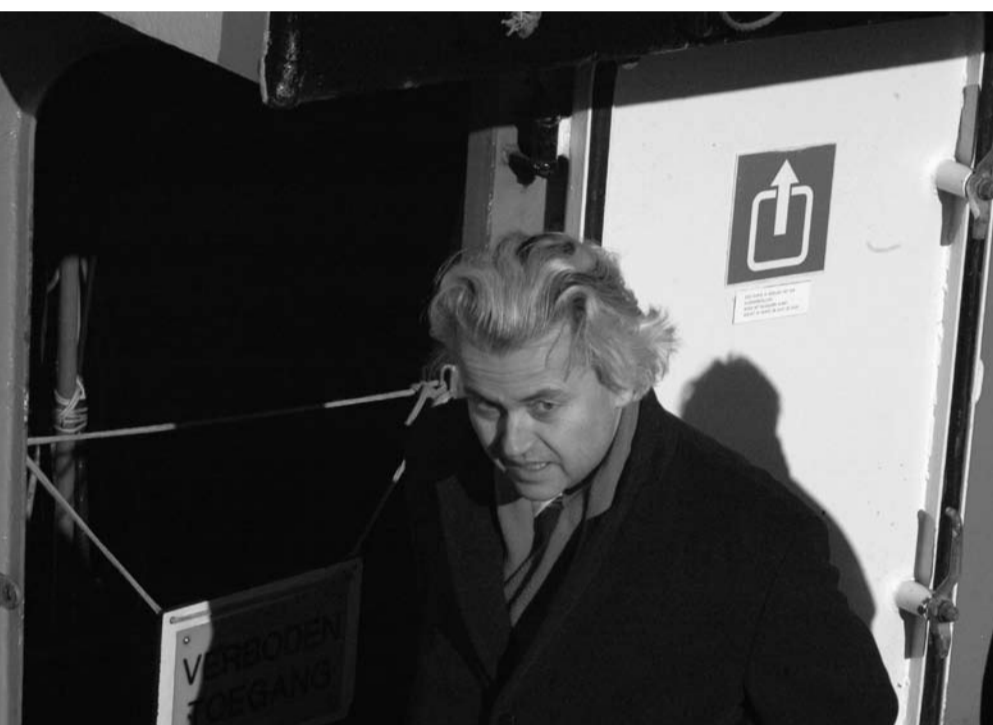
PVV-leider Geert Wilders.

kunt niet met goed fatsoen zeggen dat er een fascist aan de macht dreigt te komen, die roept dat hij misschien wel tientallen miljoenen moslims zou willen deporteren, om dan vervolgens doodleuk over te gaan tot de orde van de dag. Als links grote woorden als fascisme en nationaal-socialisme wil gebruiken, dan moet dat gevolgen hebben voor onze praktijk. Zomaar een term er tegenaan gooien is politiek volkomen destructief. In de eerste plaats dus voor onze eigen ideologie en praktijk. Maar ook voor wat de rest van Nederland van links zou gaan denken.