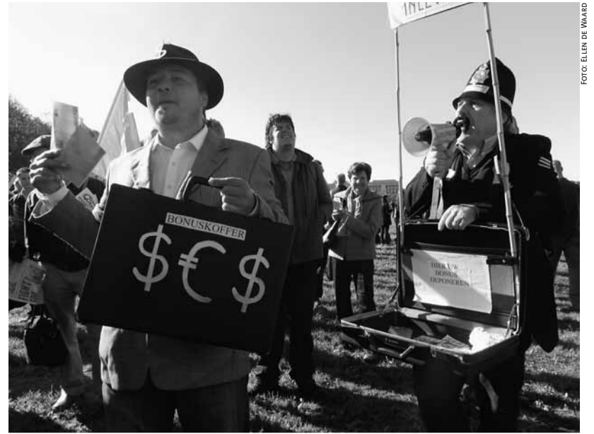
Occupy-activisten: bonussen inleveren!