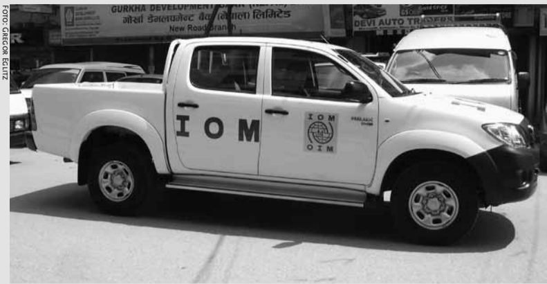
IOM in Nepal.

Immigratieminister Gerd Leers heeft in 2011 de subsidie aan stichting Duurzame Terugkeer beëindigd. 1 Inmiddels heeft hij de touwtjes van de “vrijwillige terugkeer”-projecten strakker in handen genomen. Onder regie van de Dienst Terugkeer en Vertrek (DTV) worden vluchtelingensteungroepen ertoe aangezet om te fungeren als verlengstuk van de deportatiemachine. In plaats van te strijden voor verblijfsrecht laten die zich vaak maar al te graag inzetten voor migratiebeheersing.