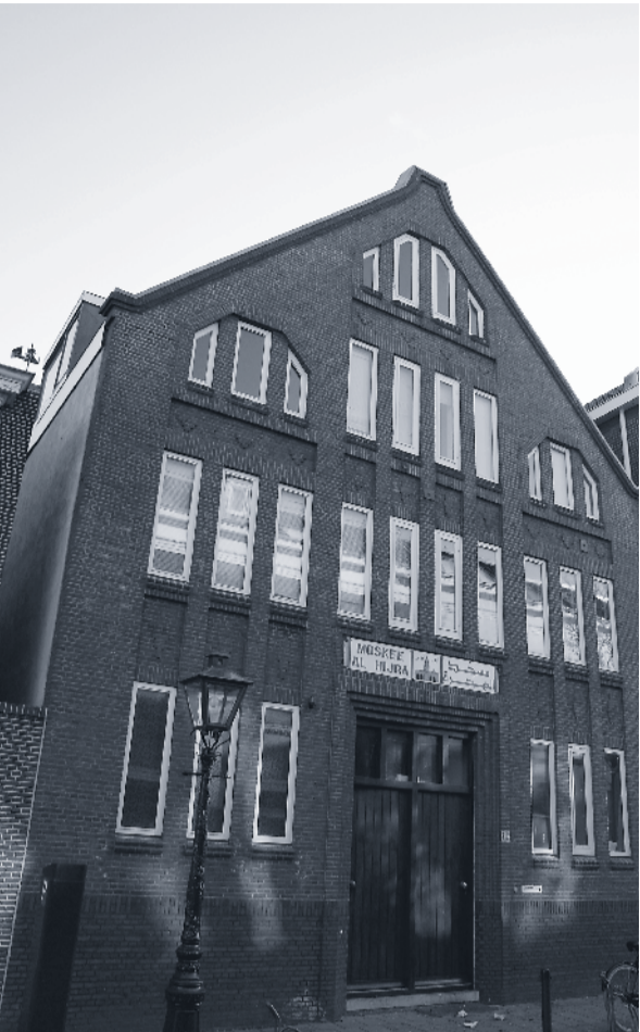
Bij de moskee aan de Leidse Rembrandtstraat zou enkele jaren geleden ook een varkenskop gedeponeerd zijn.