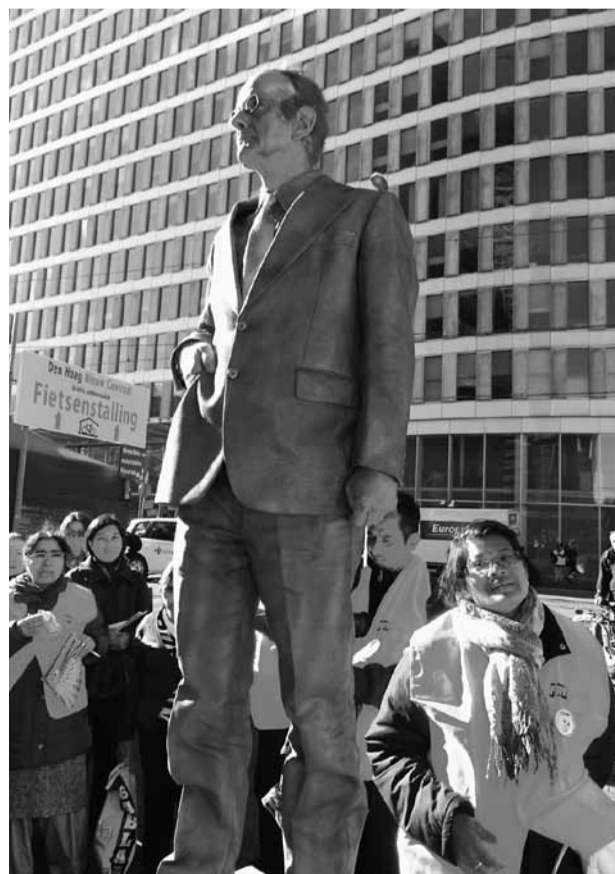
Stakende schoonmakers in actie tegen minister Henk Kamp.