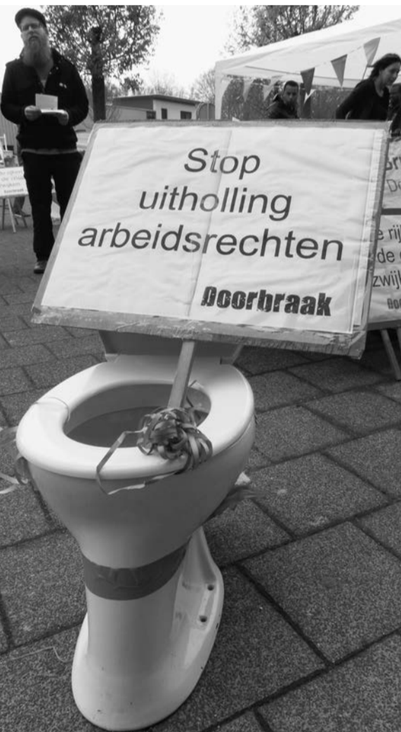
Actiesymbool van de Leidse campagne tegen dwangarbeid.

Vlak voordat het dwangarbeidcentrum werd geopend, circuleerde in kringen van gemeentelijke beleidsmakers een plan om het aantal straffkortingen voor bijstandsgerechtigden flink op te voeren via streefcijfers. Sociale Zaken zou een half miljoen euro per jaar kunnen bezuinigen door de verwachte 500 dwangarbeiders gemiddeld allemaal een maand per jaar met honderd procent te korten, of bijvoorbeeld twee keer een maand met vijftig procent. Er ontstond een heftige discussie tussen ambtenaren die voor en tegen de boetequota waren. "Het zou zijn alsof de Leidse politie van tevoren opdracht krijgt om iedereen in een bepaalde buurt op de