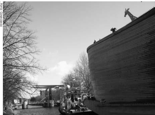
Hedendaagse Ark van Noach, gebouwd door een christelijke nutcase.

In de publicaties van Hitler-wannabees, rechts-populistisch gespuis en christenzeloten komt hun ware aard naar boven. Haat tegen Joden, niet-westerse migranten en afvalligen voert de boventoon. Daarbij geven de publicaties een aardig kijkje in het verknipte leven van deze snuiters: krankjorume ideeën zijn aan de orde van de dag.