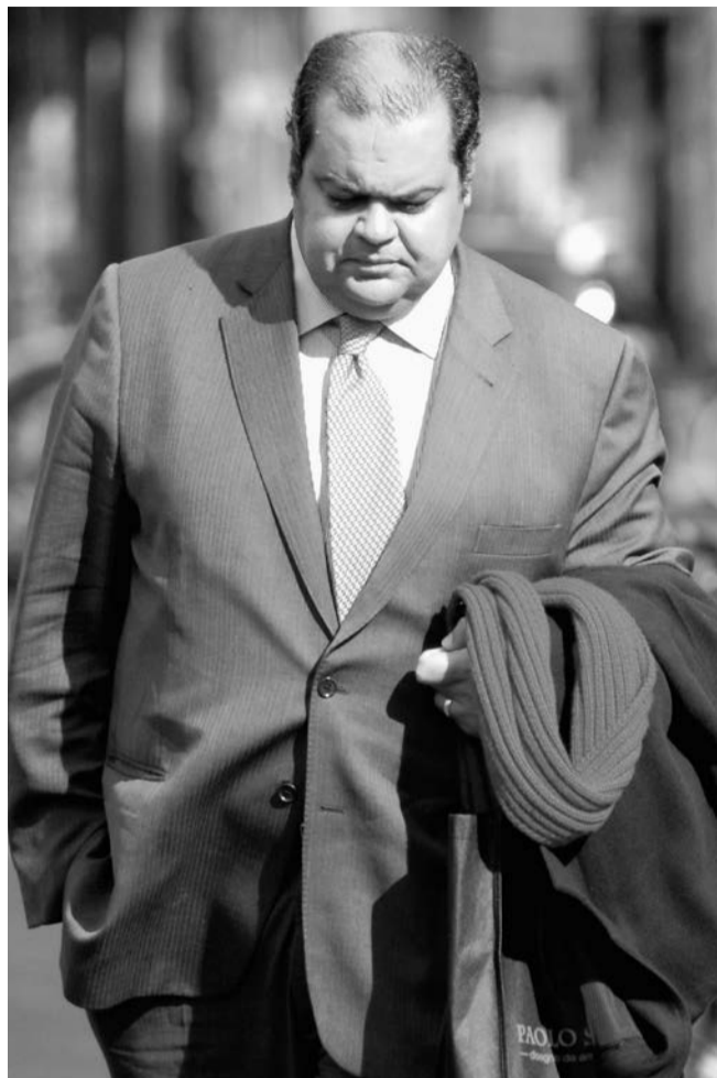
Rolmodel voor de moderne werkloze.

aan het werk komt?" En: "hoe kun je bewijzen dat iemand zich bewust slecht kleedt of gedraagt?" Veel ambtenaren vrezen dat ze door de rechter zullen worden teruggefloten. Ze gaan daarom soms over tot een informele straf, een soort treiterij, bijvoorbeeld in de vorm van "een pesttraject" als papiertjes prikken. Een andere reden om een bijstandsgerechtigde toch maar niet te straffen, is gelegen in de eigen veiligheid. "Een klantmanager merkte op dat cliënten soms weten waar je woont en dat het kan gebeuren dat ze ineens voor de deur staan." Werklozen die zich van onderop organiseren, kunnen ambtenaren met het wapen van publiciteit en protestacties in het defensief proberen te dringen. Ze doen er goed aan om zich tegenover hun "klantmanagers" weerbaar op te stellen en te beseffen dat ze samen sterk staan.