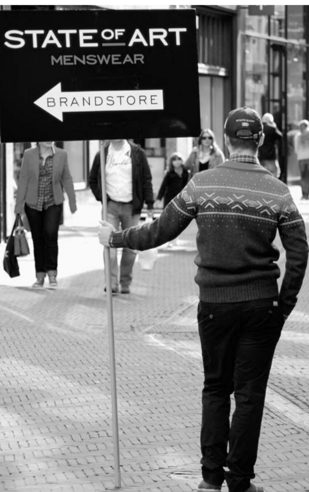
Leuke enerverende baan voor de moderne werkloze.

Het opleggen van sancties aan bijstandsgerechtigden is een tijdrovende aangelegenheid en kan averechts werken, zo stellen veel ambtenaren in het rapport. Ze dreigen dan ook liever met straf dan dat ze die ook daadwerkelijk geven. Met alleen maar dreigen kunnen ze hun onderhandelingspositie ten opzichte van de werkloze versterken zonder het risico te lopen van een bezwaar- en beroepsprocedure. De meeste “klantmanagers” menen namelijk dat straffen op grond van gedrag, uiterlijk en taal juridisch tamelijk gemakkelijk onderuit vallen te halen, omdat ze bijzonder subjectief zijn. “Hoe bepaal je wanneer iemand zich niet goed presenteert? Hoe toon je aan dat iemand om die reden niet