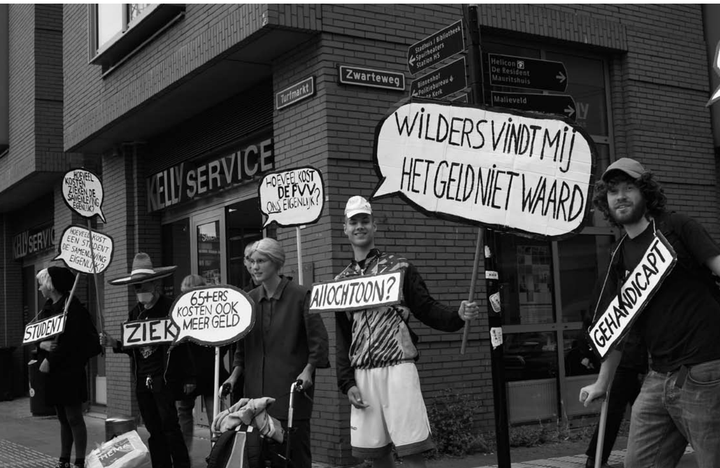
Op 25 augustus 2009 demonstreerde Anti-Fascistische Actie (AFA) tegen onderzoek naar "de kosten" van "niet-westerse allochtonen".

Op 17 juli 2009 stelde PVV-er Sietse Fritsma in een keer maar liefst 79 Kamervragen aan 12 ministeries. Hoeveel kosten "niet-westerse allochtonen" de staat, was de kernvraag. Aan zulke berekeningen doen we niet, antwoordde minister Eberhard van der Laan van Integratie uiteindelijk, ogenschijnlijk gewetensvol. Om vervolgens toch met reeksen cijfers te komen die de staat de afgelopen jaren verzameld heeft. De PVV wil conclusies verbinden aan zulke cijfers, en daarmee aan de zeer breed gedeelde opvatting dat "autochtonen" en "allochtonen" apart bekeken en gemeten moeten worden.