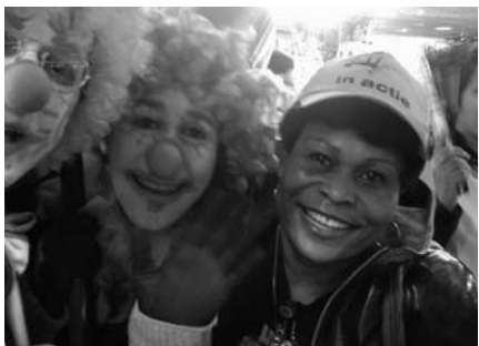
Samen vechten voor gelijke rechten blijft de beste manier om te integreren.

“Allochtonen” moeten beter inburgeren, zo roepen politici, opiniemakers en ambtenaren al jaren. Ze maken er voortdurend veel heisa om. Het is inderdaad prima als mensen Nederlands leren, maar de huidige praktijk van de gedwongen inburgeringscursussen is een gedrocht waar vooral de opleidingsinstituten (financieel) wijzer van worden.