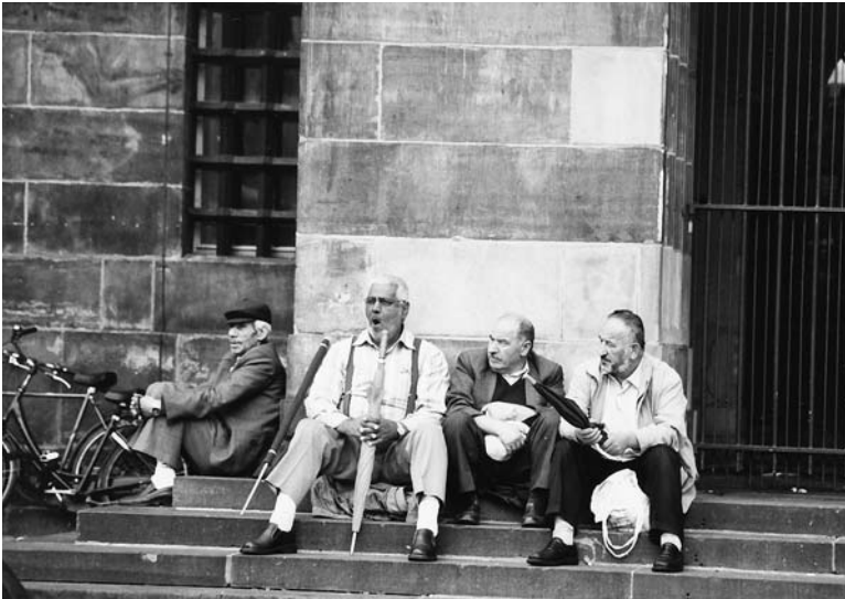
Vervolg van voorpagina "Remigranten afgeschilderd als profiteurs"

Het afnemen van hun nationaliteit verzwakt de positie van de remigranten ernstig. Ze hebben dan geen politieke rechten meer, en dus ook geen inspraak wanneer de remigratieregeling in hun nadeel zou worden aangepast, of zelfs afgeschaft. 3 Ze kunnen dan hooguit formeel bezwaar maken vanuit Marokko of Turkije, of met een toeristenvisum in Nederland. Drie jaar na de invoering van de wet was het al zover. Minister Verdonk kwam met het voorstel om de wet af te schaffen. Voor haar was het geen bezuinigingsmaatregel, maar een principiële zaak. Als migranten terug willen keren, moeten ze zelf maar voor financiële middelen zorgen, zei ze ijskoud. Migrant die al vertrokken waren, liet ze buiten schot, maar wel legde ze direct alle remigratieprocedures stil. Dat kwam haar op kritiek te staan van het Nederlands Migratie Instituut (NMI) en zelfs van de drie regeringspartijen. Ze schraptte haar voorstel uiteindelijk, maar niet voordat haar voorgerekend was dat remigratie goedkoper is dan het hier houden van die opgebruikte arbeiders. Maar het kan nog goedkoper, zo meende ze kennelijk in 2006 op bezoek bij remigranten in Marokko. Die beklagden zich over hun rechteloze positie. Waarop Verdonk met het verhaal kwam dat hun uitkering van 600 euro best omlaag kon omdat die toch drie keer zo hoog is als het plaatselijke minimumloon. 4 Dat geen mens in Marokko daar van kan leven, interesseerde haar vanzelfsprekend niet.