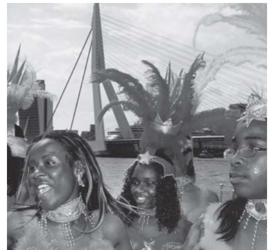
Antillianen alleen welkom in Rotterdam voor vermaak?