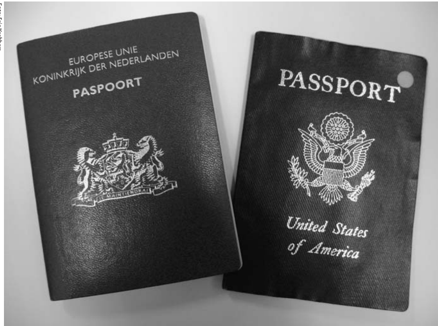
Dubbel paspoort: geen probleem.

Elk "volk" een eigen staat, dat is de ideologie van het nationalisme. Maar moderne staten hebben ook altijd staatsburgers gekend waarvan nationalist menen dat ze tot een ander "volk" behoren. Daarom worden ze ervan verdacht niet loyaal aan "volk" en staat te zijn. Dat overkwam in Nederland lange tijd de katholieken. Die hadden gewoon de Nederlandse nationaliteit, maar men verdacht hen ervan spionnen te zijn van het Vaticaan, en onthield hen daarom bepaalde burgerrechten. Zo mochten ze bijvoorbeeld lang geen ambtenaar worden. Ook Joden met de Nederlandse nationaliteit werden door velen gezien als een vreemd "volk" en zodoende niet helemaal loyaal geacht. De geschiedenis leert dat individuen die gerekend worden tot een ander "volk", in de ogen van de nationalist eigenlijk nooit voldoende kunnen assimileren om volledig geaccepteerd te worden. Ze zouden fundamenteel anders zijn vanwege hun eigen