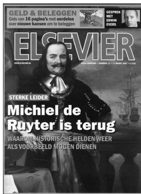
Propaganda voor Michiel de Ruyter in het blad Elsevier.

Evenals in het VOC-herdenkingsjaar 2002 1 overspoelt men het land ook nu weer met een waslijst aan festiviteiten, zoals exposities, lezingen, concerten, symposia, een replica van De Ruyters vlaggenschip "De Zeven Provinciën", bijeenkomsten met nazaten van De Ruyter, fietstochten, zeil- en vlootdagen, onderwijsprogramma's, toneelstukken, kerkdiensten, films, taptoes, een golftoernooi en zelfs een linedance-workshop. Via de merchandise website van de stichting 4 worden volop prullaria met de beeltenis van "de zeeheld" erop te koop aangeboden, zoals T-shirts, sweaters, "girlie baseball"-shirts, petten, zonnekleppen, muismatten, wandklokken, mokken, tassen, puzzels en zelfs babyslabbetjes. Nationalisme moet uiteraard met de paplepel worden ingegoten. Nieuw is die commercie overigens niet. Al in het herdenkingsjaar 1907 wist men een slaatje te slaan uit de De Ruyter-cultus. Toen leunde men met brochures, hangers, theelepeltjes, wafels, borden, en postzegels. Omvangrijk is ook het