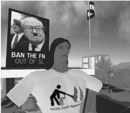
Actie tegen Front National-leider Le Pen.

In januari 2007 opende het Franse Front National van Jean-Marie Le Pen een partijkantoor in de plaats Porcupine. Dat leidde tot hevige gevechten tussen fascisten en anti-fascisten. Daarbij werd over en weer met scherp geschoten en werden bommen en exploderende varkens gegooid. Dat er geen doden vielen, mag een wonder heten. Of toch niet?