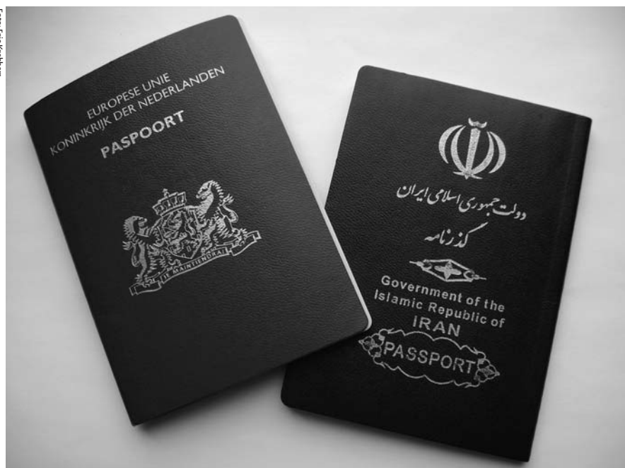
Dubbel paspoort: groot probleem.